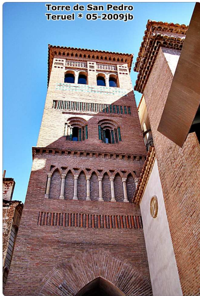
Torre de San Pedro Teruel * 05-2009jb

Torre mudéjar del S. XIII (la más antigua de Teruel) con 25 metros de altura, que atañe a la tradición de los campanarios cristianos y destaca por su decoración con frisos cerámicos morados y verdes (estos últimos son únicos en el mudéjar de Teruel) y similar a la Torre de la Catedral. Se compone de una única torre exterior de planta rectangular y dividida en tres recintos superpuestos. En su planta inferior se abre pasadizo con arco ojival abovedado de cañón apuntado, que permite la circulación viaria.