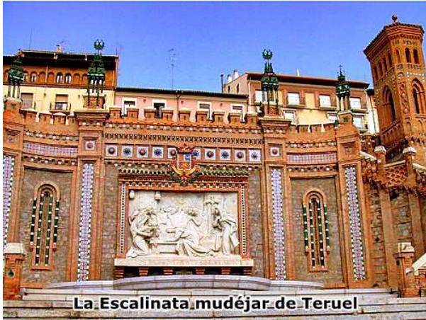
La Escalinata mudéjar de Teruel

Obra neo-mudéjar con dos torres, construida en el año 1920 por el ingeniero José Torán, bajo la protección de Carlos Castel, con el fin de unir la estación del ferrocarril con el centro de la ciudad, salvando los 26 metros de desnivel existente.