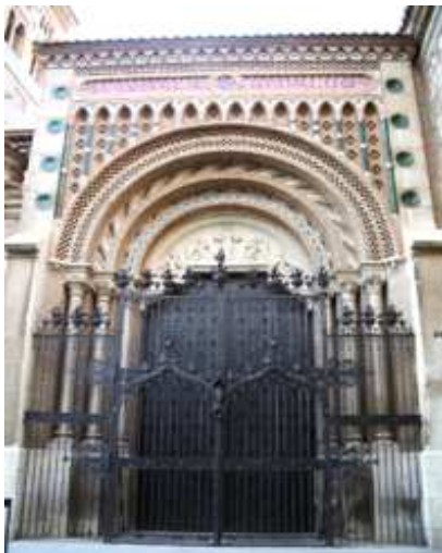
Portada meridional 1909