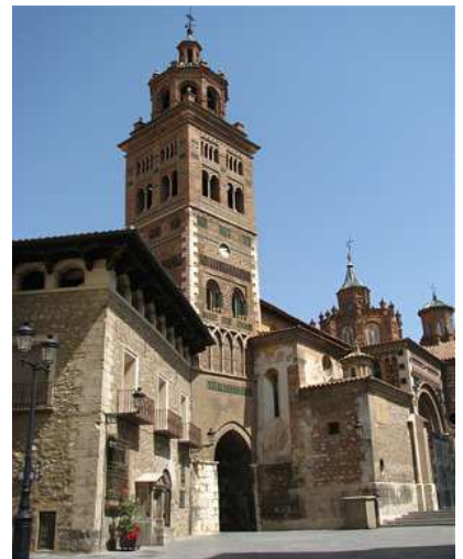
Catedral y Torre S. XIII