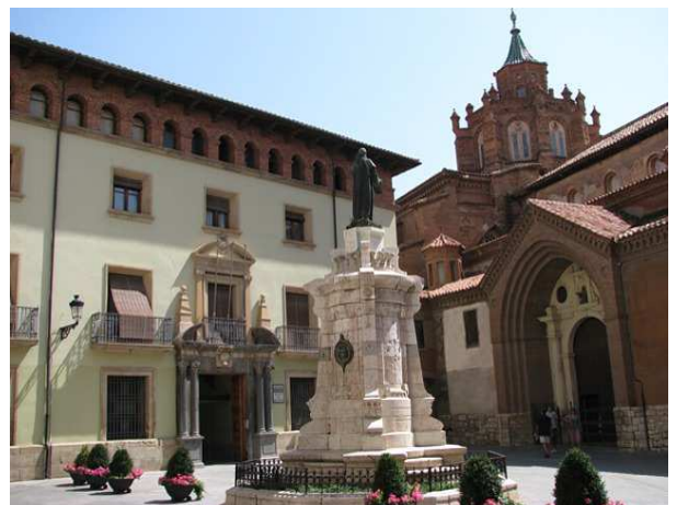
Fachada posterior de la catedral